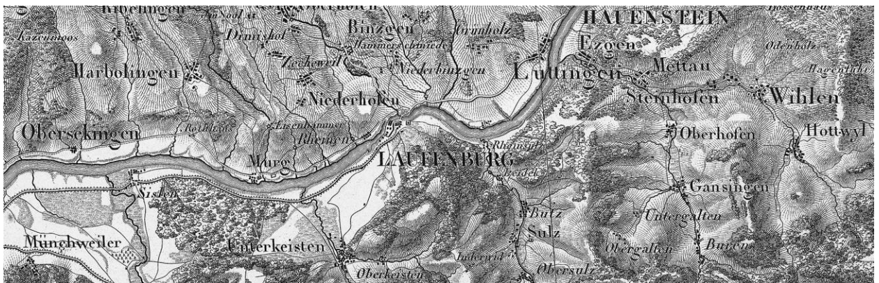
Carte topographique de l'ancienne Souabe 1:100 000 (T-27 Freiburg 1818 / T-26 Rheinfelden 1819)

Museum zum Schiff, Fluhgasse 156, Laufenburg ( http://www.museum-schiff.ch/ )